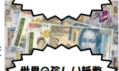
世界の珍しい紙幣展にご注目!